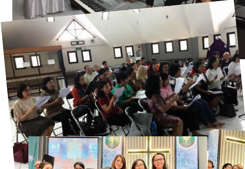
Sesi latihan bersama