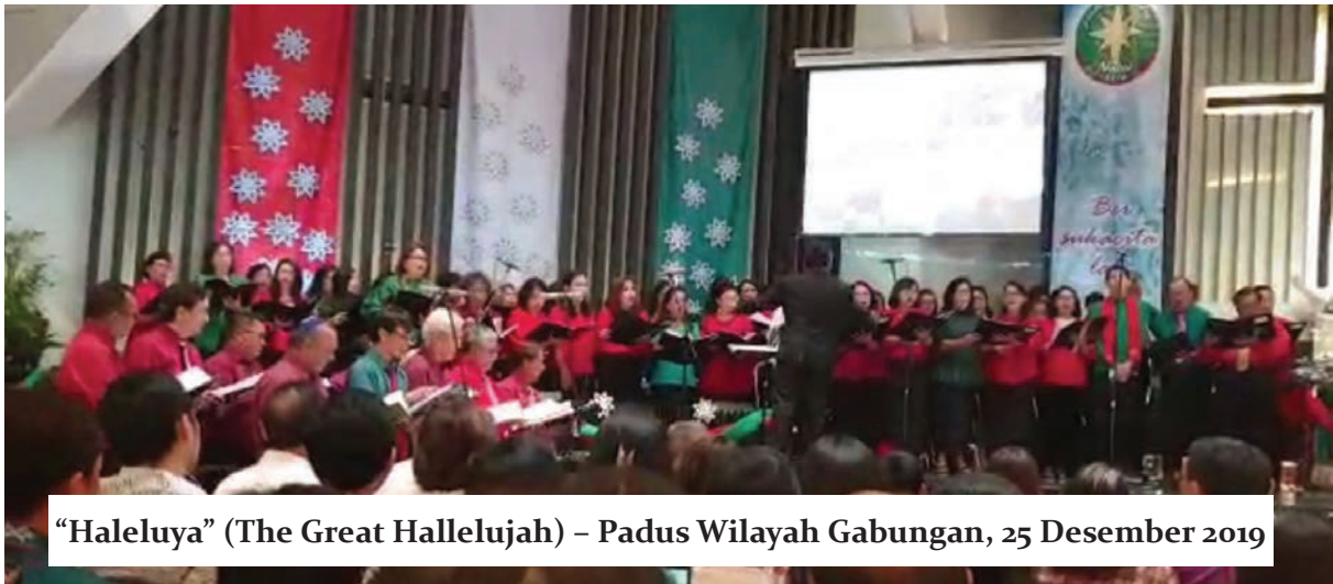
“Haleluya” (The Great Hallelujah) – Padus Wilayah Gabungan, 25 Desember 2019

Paduan Suara Wilayah Gabungan Natal 25 Desember 2019